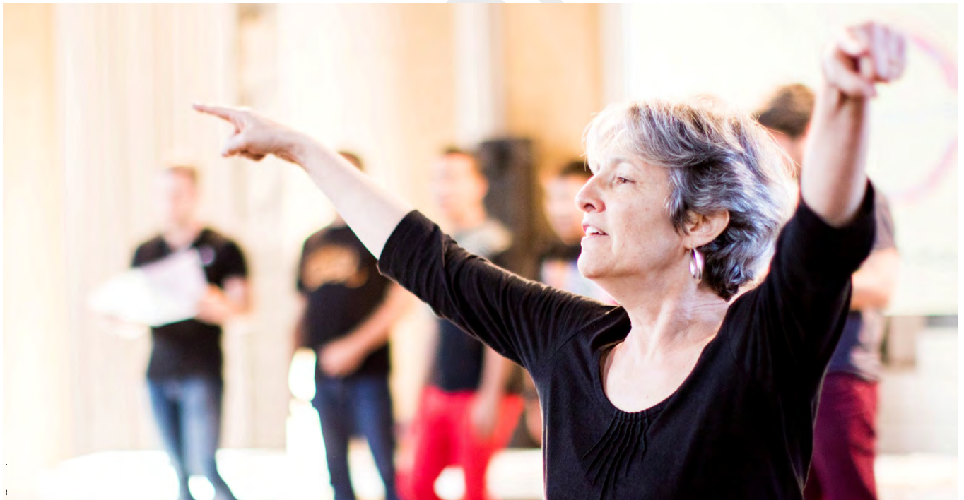
Conducting 21C workshop, Stockholm.