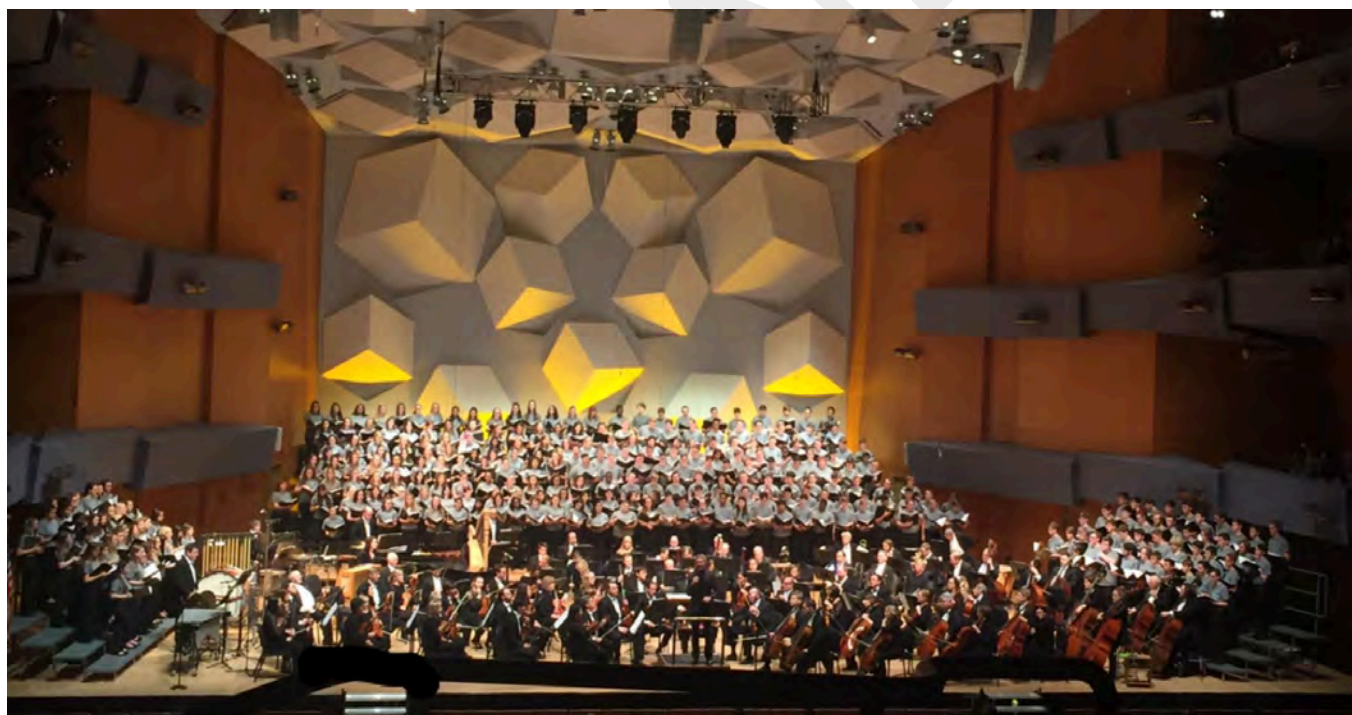
The National High School Honor Choir directed by Eric Whitacre, accompanied by the Minnesota Orchestra.

美好的一周扫去了灵魂深处的灰霾。下一届美国合唱指挥协会全国大会将在 2019 年 2 月/3 月在密苏里州堪萨斯举行，并将迎来协会的钻石庆典。