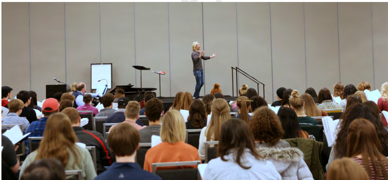
The National High School Honor Choir diretto da Eric Whitacre.

Insomma una settimana di musica bellissima e riposante. La prossima conferenza di ACDA avrà luogo a Kansas City, Missouri, in febbraio/marzo, 2019, anno in cui cadrà l'anniversario di diamante dell'American Choral Directors Association.