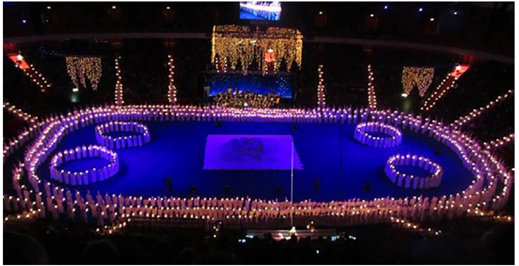
1.400 Sängerinnen und Sänger der Adolf Fredriks Musikklassen und des Stokholmer Musikgymnasiums während eines Lucia Konzerts, das sie während des Weltchortags feierten.