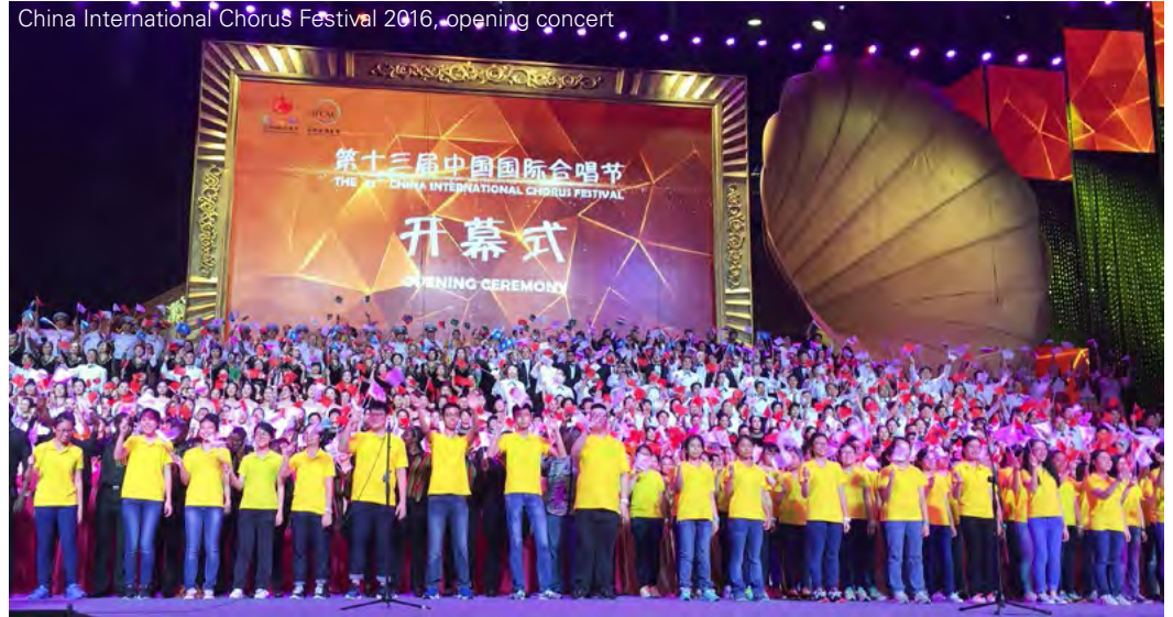
China International Chorus Festival 2016, opening concert

IFCM 이사회는 2020년도 WSCM12의 IFCM 집행대표자 명단을 발표하게 되어 기쁘게 생각합니다.