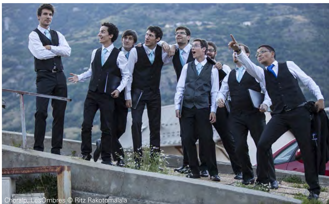
Choralp, LesOmbres

연락처 : choralp@gmail.com — 웹사이트 : www.choralp.fr