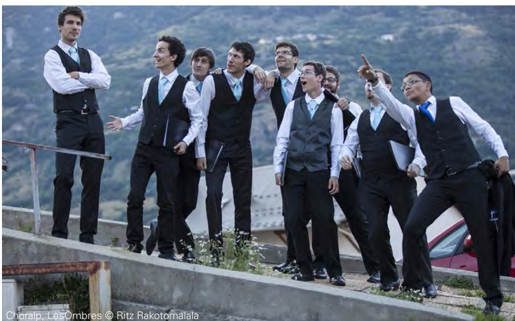
Choralp, LesOmbres