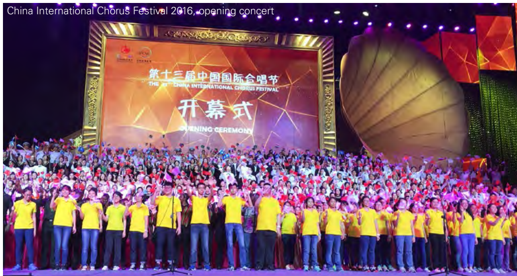
China International Chorus Festival 2016, opening concert

Il Board di IFCM è lieto di annunciare i nomi dei Rappresentanti di IFCM per il WSCM12 – 2020: