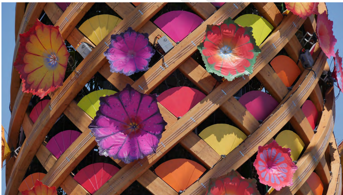
Expo Milano, the Tree of Life

Besuchen Sie die Facebook -Seite oder Feeding Souls, Thanking for Food