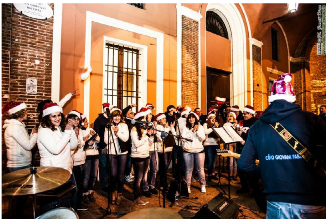
Coro Giovani Fabrianesi, Italie, célébrant la Journée mondiale du Chant choral (2014)

Tous ces enregistrements combinés seront compilés par la Fondation Aequalis qui produira également une vidéo finale. Cette vidéo sera diffusée le 7 décembre en connexion avec la célébration de la Journée mondiale du Chant choral. Elle sera distribuée au niveau mondial via les réseaux sociaux et les sites Web individuels. Pour plus d'infos sur ce projet, contactez communication@ifcm.net , la Fondation Aequalis à Caracas par courriel: info@ciccag.org , ou visitez: https://www.ciccag.org/en/virtual-choir-voxpathuli/