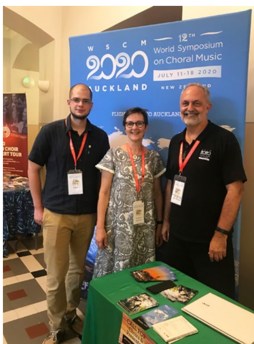
L'équipe de la FIMC et du WSCM2020 à Tallinn