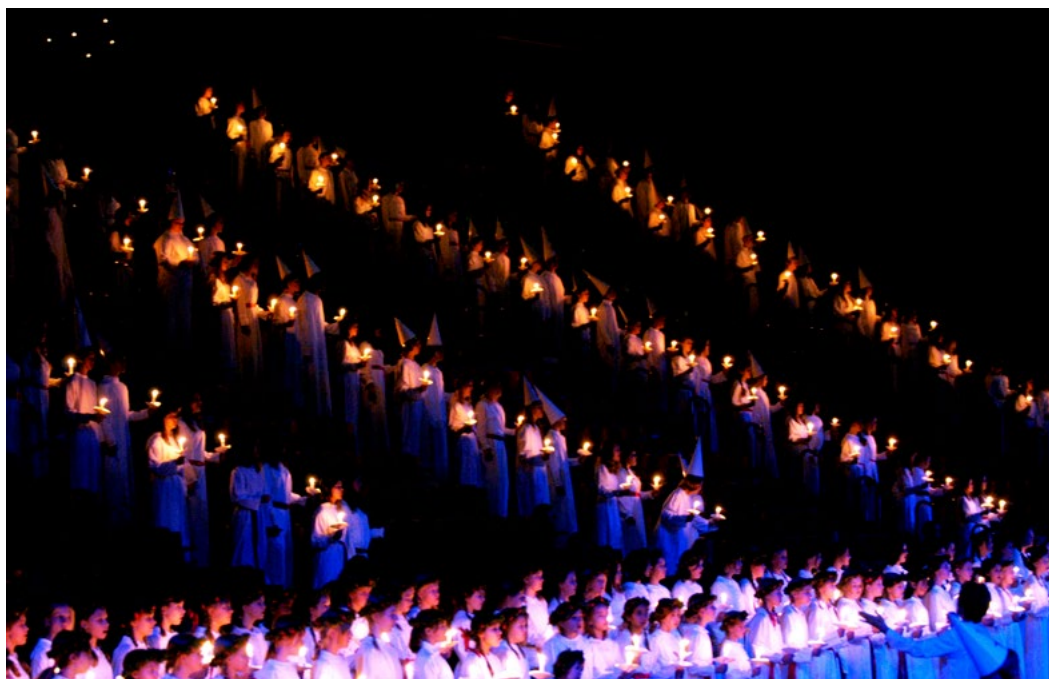
Picture: 1400 Singers from Adolf Fredriks Music Classes and the Stockholms Musikgymnasium celebrating the World Choral Day during their annual Lucia concert

En 2018, un aniversario especial hace que el Día Mundial del Canto Coral sea aún más significativo: el centenario del fin de la Primera Guerra Mundial amplía la duración habitual de esta actividad mundial que se extenderá a una participación virtual durante más de un mes.