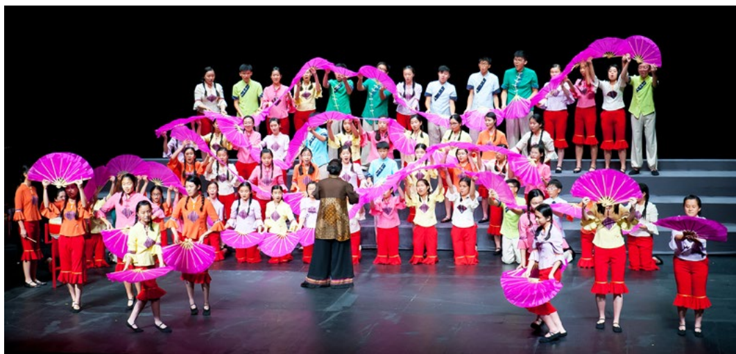
Hong Kong Children's Choir, cond. Kathy Fok

http://www.choralsummit2019.hk/ - Formulario de inscripción