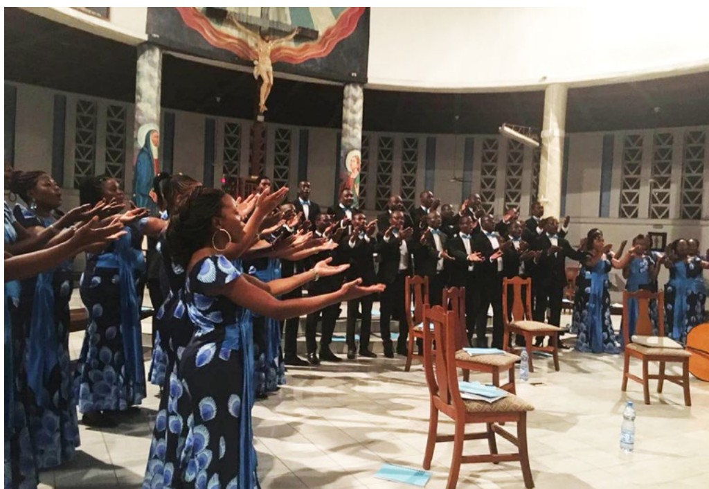
Días Corales A Coeur Joie Gabon: Gran Coro A Coeur Joie Gabón, Grupo Vocal Le Chant sur la Lowé, La Voix des Jeunes y Dominique Savio (Concierto de clausura de la semana coral A Coeur Joie y sesión de entrenamiento en Libreville y Port-Gentil, Gabón)

¿Te gustaría saber cómo funciona? Mira este video corto aquí: VIDEO HERE