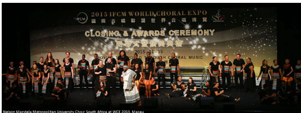
Nelson Mandela Metropolitan University Choir, South Africa at WCE 2015, Macau

EXPO CORAL MUNDIAL 2015 | Lo más destacado del video de la ceremonia de clausura.