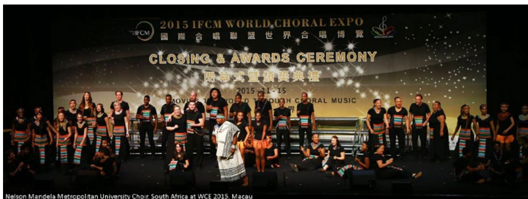
Nelson Mandela Metropolitan University Choir, South Africa at WCE 2015, Macau

Опыт хорового искусства во всей красе и завести новых поющих друзей в захватывающем Лиссабоне. См. World Choral EXPO 2019 для получения дополнительной информации об условиях участия и деталях регистрации. Следите за обновлениями на странице World Choral EXPO в Facebook. Всемирная хоровая выставка 2015 | Основные моменты из видео церемонии закрытия