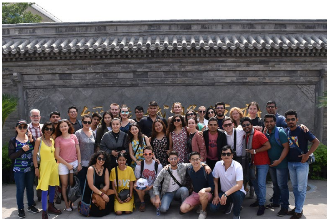
SCO Countries Youth Choir Singers visiting the ancient residence of generals

REPERTORIO de 10 países (Afganistán, Bielorrusia, China, India, Mongolia, Irán, Kazajistán, Rusia, Turquía, Uzbekistán) en 12 idiomas (árabe, bielorruso, dari, inglés, farsi, hindi, kazajo, mandarín, mongol, ruso, turco), Urdu, uzbeko).