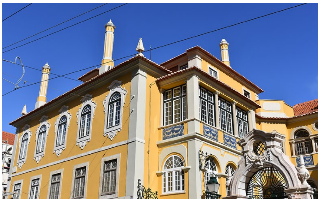
New head office of IFCM, Palacete dos Condes de Monte Real, Lisbon

La FIMC est heureuse d'annoncer qu'une nouvelle version des statuts et du certificat de constitution de la FIMC, ainsi qu'un nouveau document de politique interne , ont été votés à l'unanimité par l'Assemblée générale. Tous ces nouveaux documents peuvent être trouvés en cliquant sur leur nom respectif.