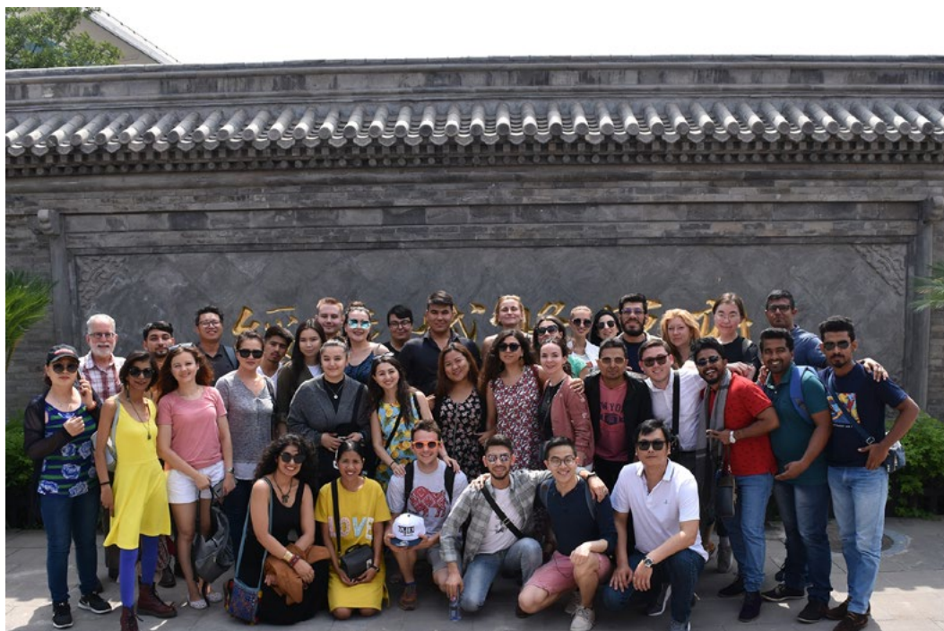
SCO Countries Youth Choir Singers visiting the ancient residence of generals