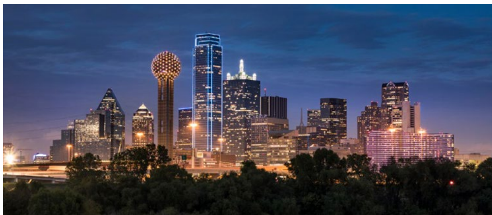
ACDA National Conference 2021 (Dallas, Texas, USA)

Conférence nationale d'ACDA - Mar. 17-20, 2021 (Dallas, TX)