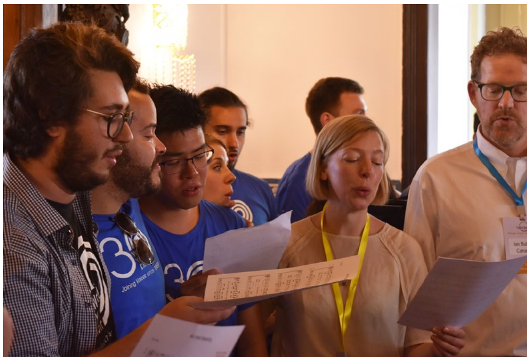
WYC 2019 singers and alumni singing 'Irish Blessing' at the Palacete dos Condes de Monte Real, IFCM new home

Vea el sitio web de WYC para más detalles de la audición.