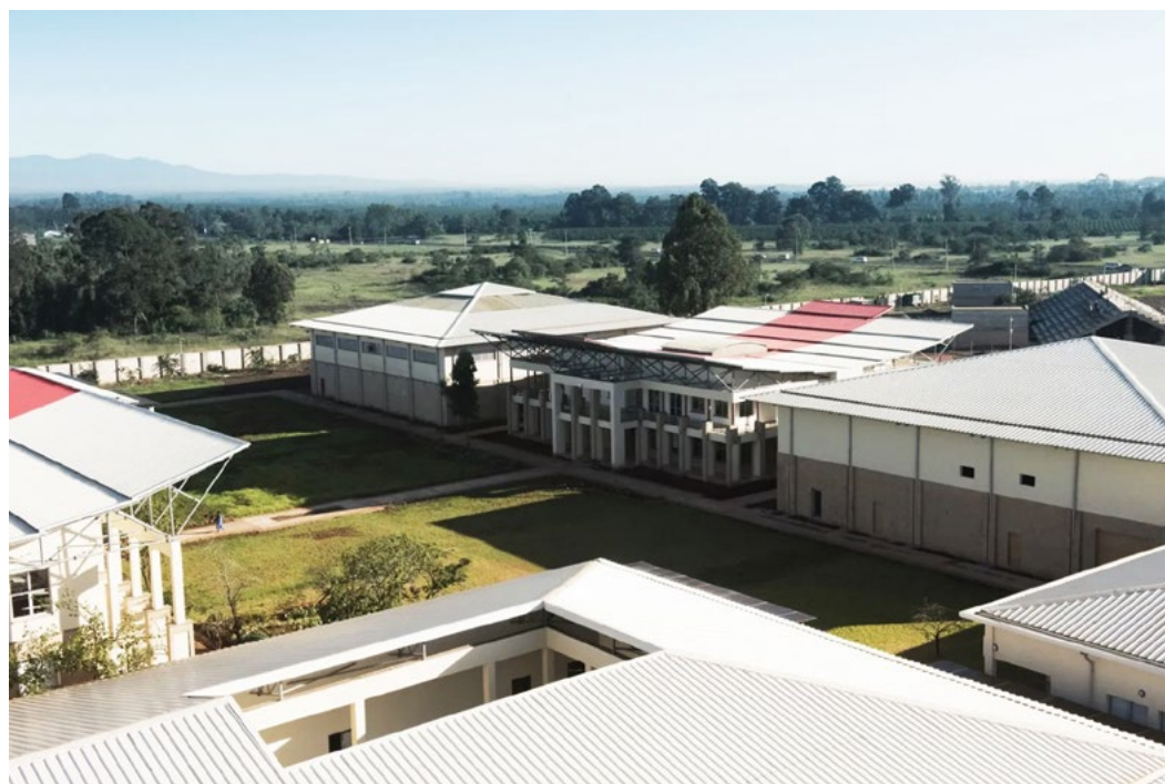
Mpresa Foundation Auditorium (center), one of the venues of the Festival

Venez à Nairobi et profitez de la riche diversité de la musique chorale de différentes régions d'Afrique et du monde entier! Jambo Kenya !