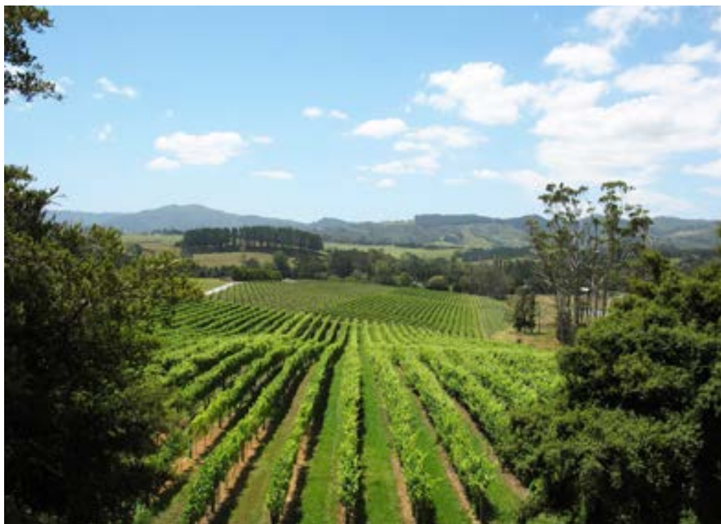
Wineyards on Waiheke Island

E avrai uno sconto sul costo di registrazione al WSCM2020!