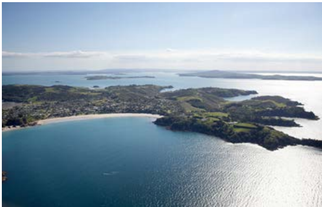
Aerial view of Waiheke Island