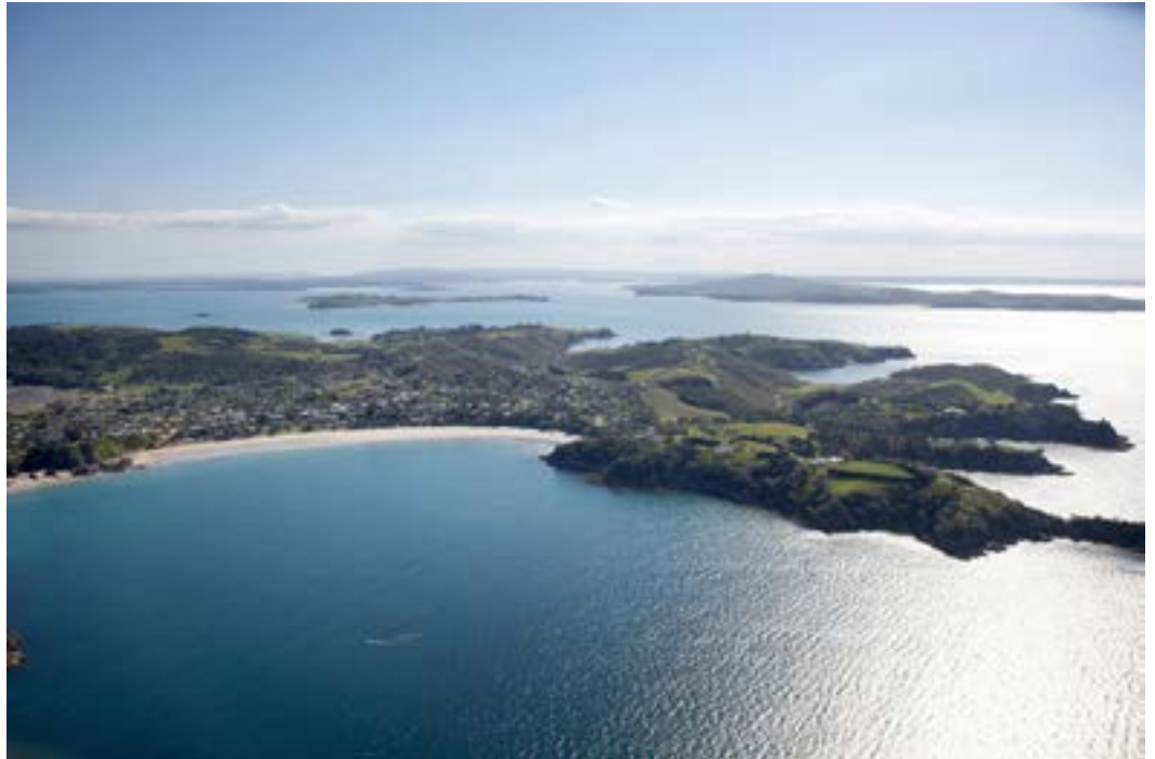
Aerial view of Waiheke Island