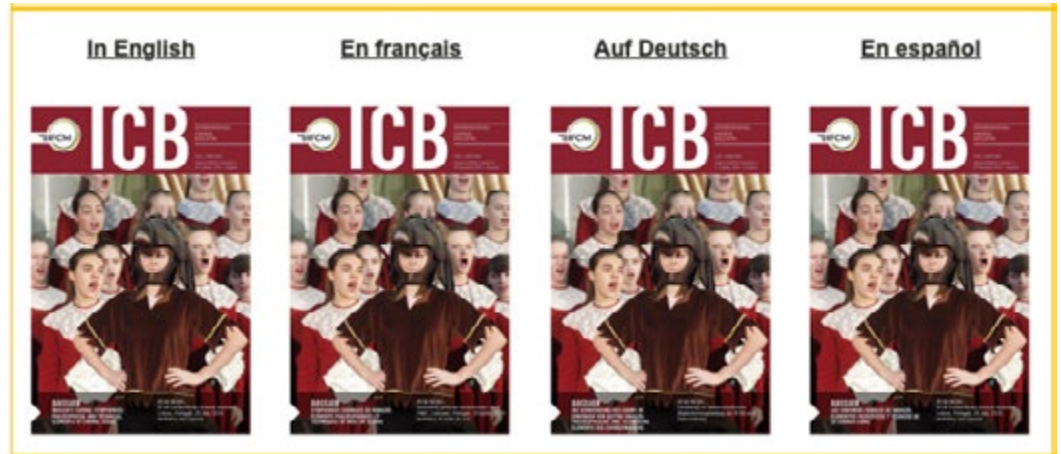
International Choral Bulletin, Volume XXXVIII, Number 2, 2 nd Quarter, 2019

und Russisch aufzubauen. Die Zusammenarbeit mit dem russischen Team führte zu mehr als nur Übersetzungen von ICB-Inhalten und es wurde beschlossen, auf der IFCM Website eine neue Seite zu schaffen, gänzlich auf Russisch und mit leichtem Zugang für russischsprachende Besucher*innen. Die ICB-Artikel (wie auch die IFCMeNEWS) wurden bereits in den letzten 10 Monaten auf Chinesisch auf dem IFCM WeChat Account veröffentlicht. Das WSCM 2023 Team in Doha ist dabei, ein Netzwerk von Übersetzer*innen aus arabischen Ländern aufzubauen. Um mehr Sprachen zur Verfügung zu haben mussten einige Anpassungen vorgenommen