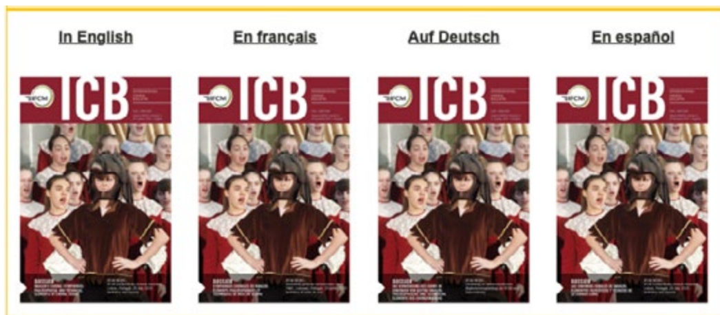
International Choral Bulletin, Volume XXXVIII, Number 2, 2 nd Quarter, 2019

per il WSCM 2023 di Doha sta attivamente creando una rete di traduttori nelle nazioni arabe. Per avere a disposizione più lingue, si sono dovuti applicare degli aggiustamenti. Questo è quanto è stato deciso dal Board di IFCM: