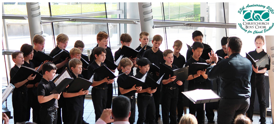
Le 28 novembre dernier, le Christchurch Boys' Choir a dédié son concert du 30ème anniversaire à la Journée mondiale du chant choral

Pour plus d'informations, consultez la Journée mondiale du chant choral . Pour vous inscrire / souscrire à votre concert, cliquez ici .