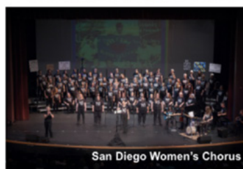
San Diego Women's Chorus