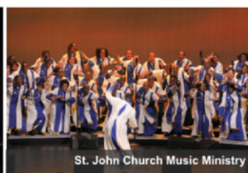
St. John Church Music Ministry