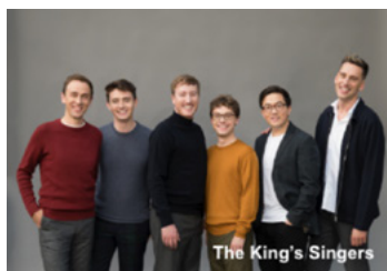
The King's Singers