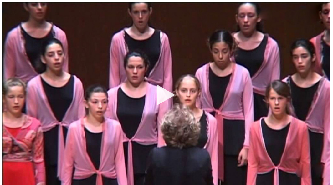
The Efroni Choir, two Songs from the Yemenite tradition

Durante los años 2005-2011, Maya fue miembro de la junta de IFCM, donde hizo una contribución enorme y positiva a nuestra comunidad coral. En 2005, Zimriya, la Asamblea Mundial de Coros de Israel, organizó una sesión del Coro Mundial de Jóvenes; Hallel, la Organización Coral Israelí; y Jeunesses Musicales Israel. En 2006, Maya ayudó a la FIMC a celebrar en Jerusalén su tercera Conferencia multicultural y étnica centrada en Jerusalén como centro de tres de las grandes religiones, tradiciones y culturas abrahámicas: el cristianismo, el islam y el judaísmo. Esta visión es una que la IFCM todavía valora años después, a medida que se acerca la WSCM 2023/24 en Qatar. Desafortunadamente, la FIMC decidió cancelar