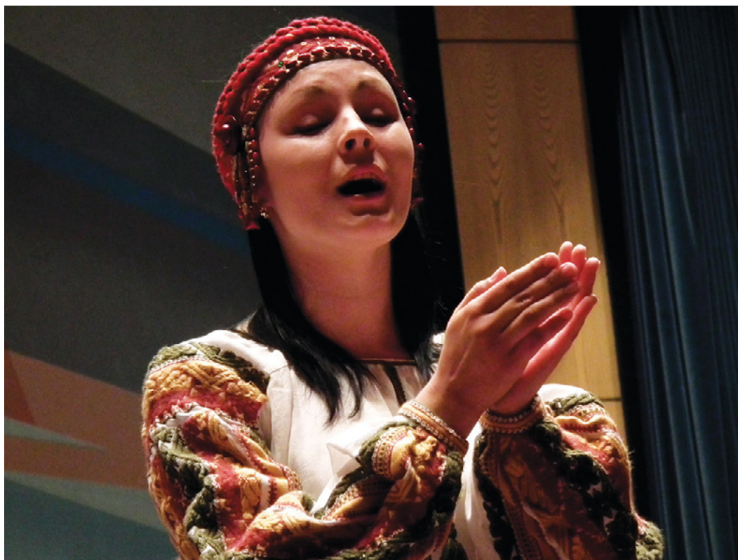
One chorister of the Female Choir of Glier Institute of Music, Kyiv

Al hacer clic AQUÍ , accederás a un artículo con detalles sobre cómo buscar este tema en la base de datos coral de Musica International. Cuenta con información sobre una serie de partituras resaltadas de esta manera, así como un enlace que te permite acceso ilimitado usando los privilegios de miembro de la FIMC a todas las áreas del sitio (disponible en inglés, francés, alemán y español).