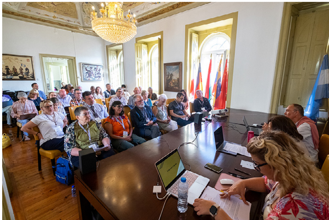
IFCM 2022 General Assembly at the Palacete dos Condes de Monte Real

オンライン投票が無事終わり、IFCMの定款と会員規約*の複数の変更が認められたあと、IFCMの会員50名以上が、2022年9月4日、ポルトガルの首都リスボンのモンテアル伯爵邸で開かれた総会に出席して、IFCMのさまざまなプロジェクトや活動について直接報告を聞き、質問や提案をする機会を得ました。また、この場を借りて、エミリー・クオ・フォン会長は、IFCM理事会の決定により、2名の方の死後表彰を行うことを発表しました。