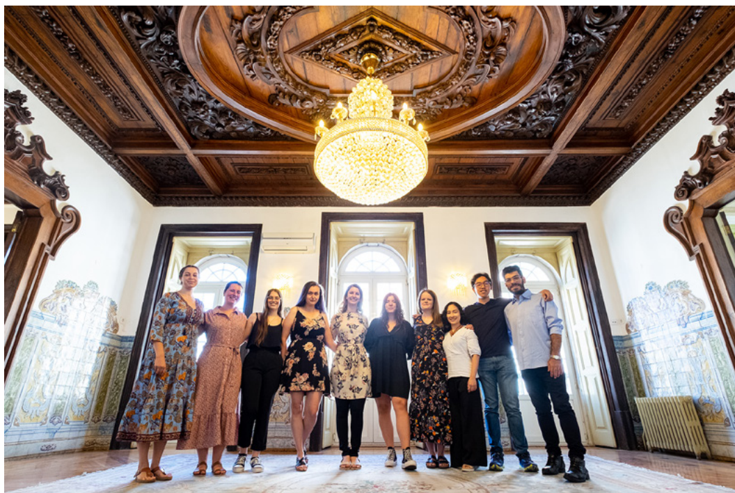
YOUNG participants at the Palacete dos Condes de Monte Real

IFCMはまた、YOUNGの最高のメンバーたちにもお礼を申し上げたいと思います。YOUNGとは、今年IFCMが新たに立ち上げた国際文化マネージメント・プログラムです。2022年5月に選ばれたこの10名の若いマネージャーたちは、リスボンにおける彼らの最初の週末に討論会とセミナーに参加し、文化イベントの準備と運営に関してさまざまなことを学びました。