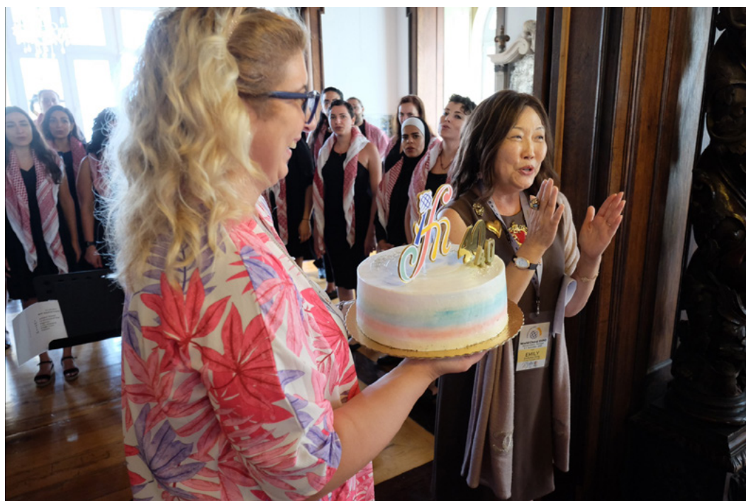
Happy Birthday IFCM!

https://www.40-years-of-ifcm.worldchoralexp.org 。