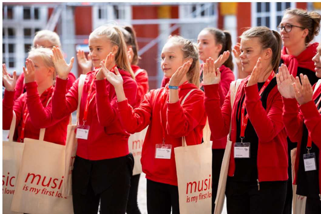
Eurotreff 2019