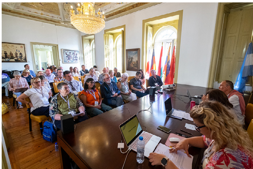
IFCM 2022 General Assembly at the Palacete dos Condes de Monte Real