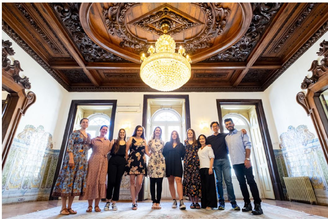
YOUNG participants at the Palacete dos Condes de Monte Real