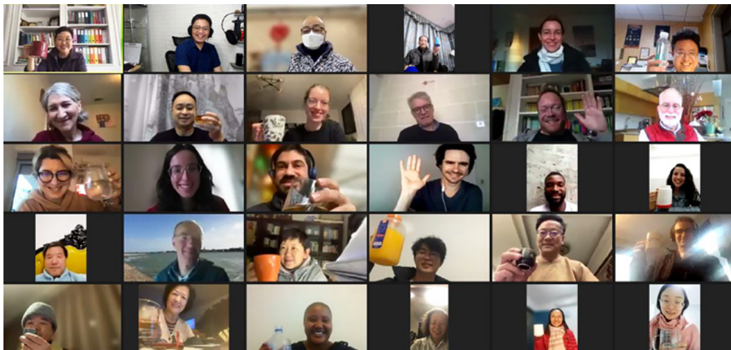
One view of the meeting with around 100 members