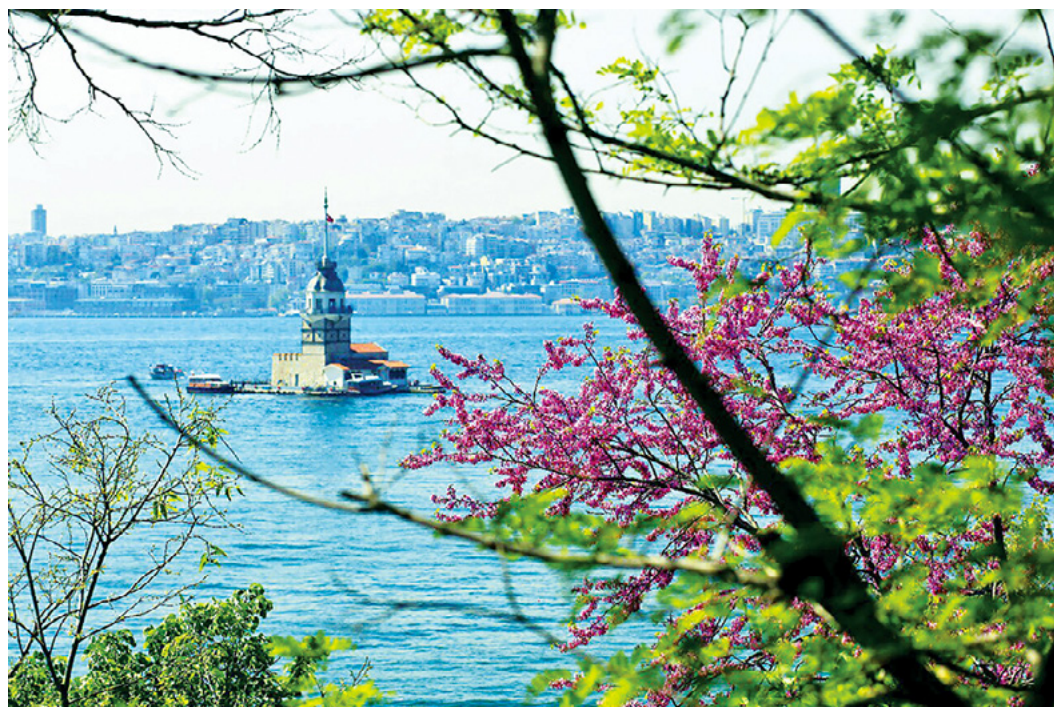
Judas trees blossoming before Maiden's Tower

Alors que nous célébrons la nouvelle année, la perspective du WSCM 2023 prend de l'ampleur,