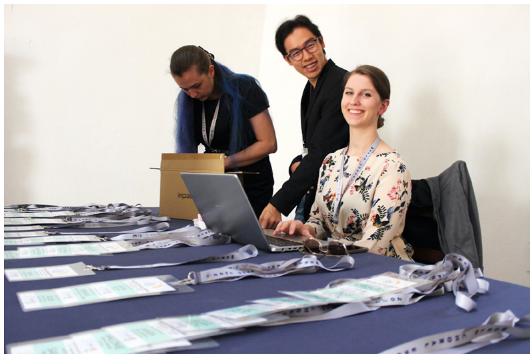
YOUNG 2022 - World Choral EXPO, Oeiras, Portugal © Anna Palcsó

Après le grand succès du programme dans le cadre de l'EXPO chorale mondiale 2022, nous sommes heureux de lancer un appel pour le deuxième programme YOUNG! Vous avez entre 18 et 35 ans? Vous souhaitez faire partie de l'équipe organisatrice du Symposium Mondial sur la Musique Chorale 2023? La FIMC et l'Association Chorale Culture d'Istanbul en Türkiye lancent un appel aux jeunes managers culturels pour rejoindre leur équipe et élargir leur expérience et leur domaine de compétence tout en travaillant en étroite collaboration avec l'équipe organisatrice du WSCM 2023.