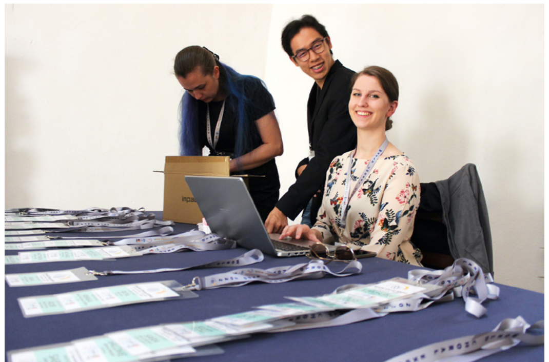
YOUNG 2022 – World Choral EXPO, Oeiras, Portugal

https://wscmistanbul2023.com/wscm/young 的更多信息