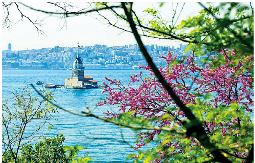
Judas trees blossoming before Maiden's Tower © Kız Kulesi

伊斯坦布尔世界合唱音乐研讨会 (2023 年 4 月 25 日至 30 日) 当我们准备迎接 2023 年时，WSCM 的兴奋不仅在伊斯坦布尔，而且在全世界都在升温。快来注册将在贝伊奥卢 (Beyoglu) 举行的研讨会！贝伊奥卢是伊斯坦布尔最受欢迎的旅游胜地之一。在为期 6 天的研讨会期间，来自 5 大洲的 11 支合唱团和来自 26 个国家的 37 位演讲者将在 10 个不同的场地参加。超过 16,000 名观众将在拥有 2040 个座位的歌剧院和其他场地参加研讨会。如果您想参加这个将在伊斯坦布尔最美丽的场所举行的研讨会，请预订您的位置。有关应用程序