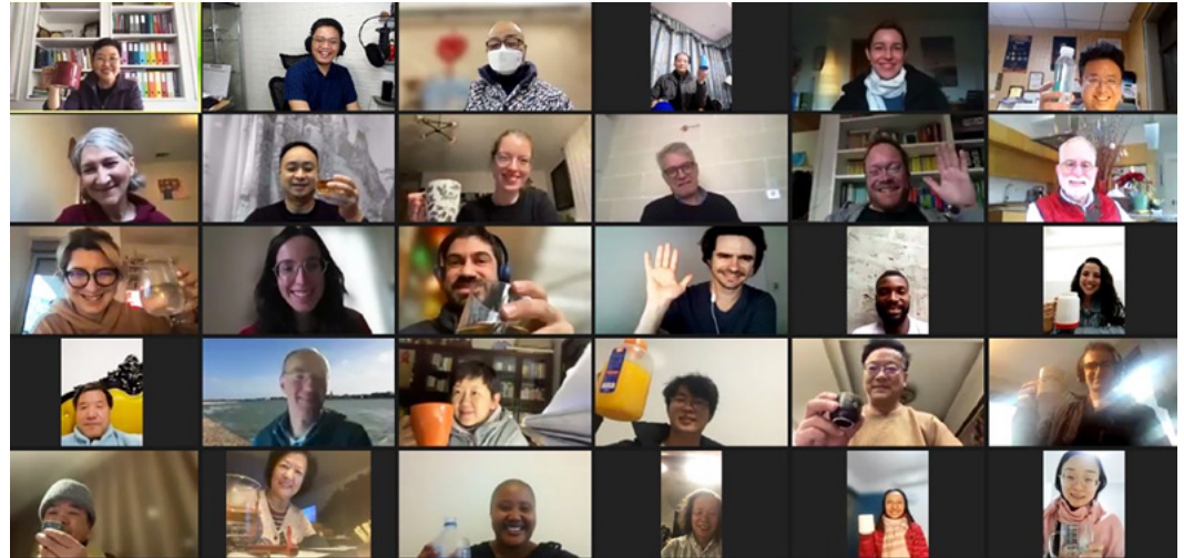
One view of the meeting with around 100 members

合唱活动。会议将介绍 IFCM 项目，特别是即将举行的世界合唱音乐研讨会。在线会议室随后被分成四个不同的房间，讨论作曲家、指挥家、歌手和经理人的兴趣点。会议在友好的新年祝酒声中结束。如果您也想参加我们下一次的在线会议和活动，请按照以下步骤操作。