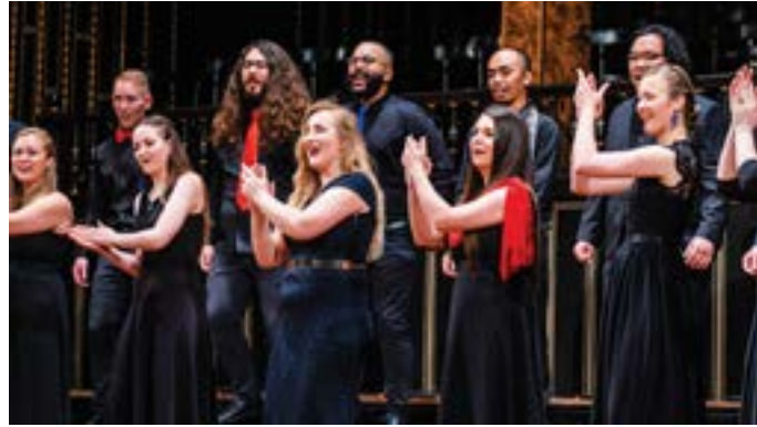
The World Youth Choir Alumni in Budapest in 2023

Les dates limites des auditions nationales peuvent être plus rapprochées afin de respecter la date limite du jury international. Vérifiez auprès de vos recruteurs nationaux .