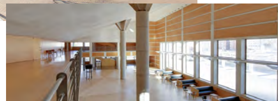
The Foyer of L'Auditori, World Choral Expo