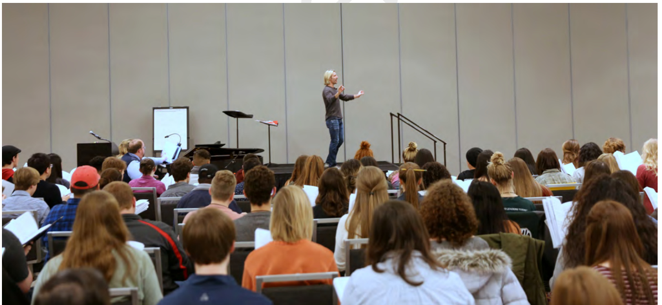
Une répétition du Chœur d'Honneur ACDA du Secondaire, dirigé par Eric Whitacre.

Une merveilleuse semaine musicale a apaisé les âmes angoissées. La prochaine Convention ACDA aura lieu à Kansas City dans le Missouri, en février ou mars 2019, qui sera également le soixantième anniversaire d'ACDA.