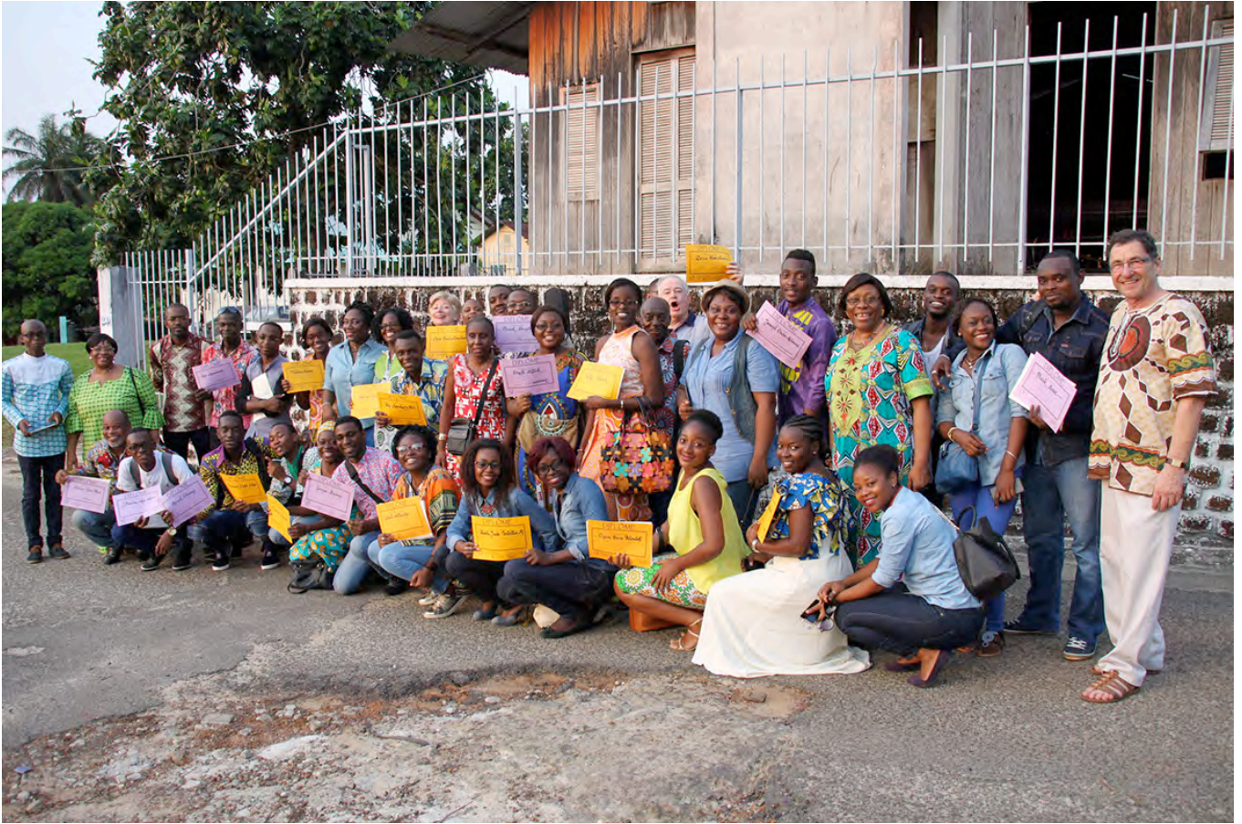
CWB Session in Libreville, Gabon (9-14)

CWB 임무에 대한 상세 정보 : http://ifcm.net/cwb-2/