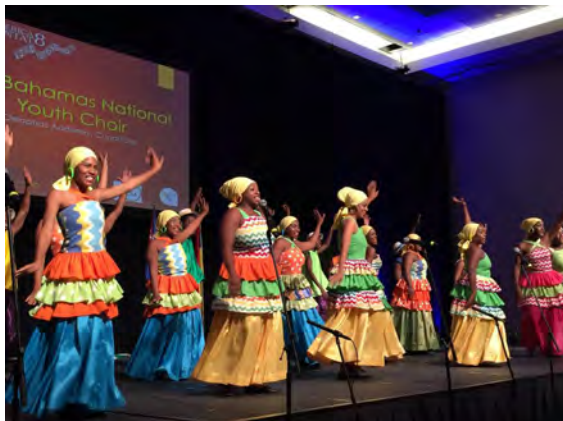
Bahamas National Youth Choir at Opening Ceremonies

AMERICA CANTAT 8 s'est clôturé le 31 août à Nassau aux Bahamas. Plus de 500 personnes, représentant 16 pays de quatre continents, se sont rassemblés durant dix jours pour apprendre et chanter la musique chorale riche et variée des Amériques. C'était la première fois que le festival America Cantat prenait place dans un pays anglophone, et la première fois que les Bahamas accueillait un événement choral international. Un partenariat entre l'Association des Chefs de Chœur Américains, l'organisation America Cantat, et le Ministère du Tourisme des Bahamas, a permis à ce festival de perpétuer son but d'échanges culturels et artistiques en place depuis 24 ans; les participants tout comme les dirigeants de ce festival furent en majorité satisfaits du succès de cette huitième édition d'America Cantat. A travers les concerts planifiés ou improvisés, les ateliers dirigés par des chefs de renommée mondiale,