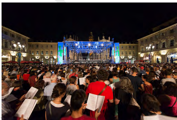
MITO, Piazza San Carlo, Turin