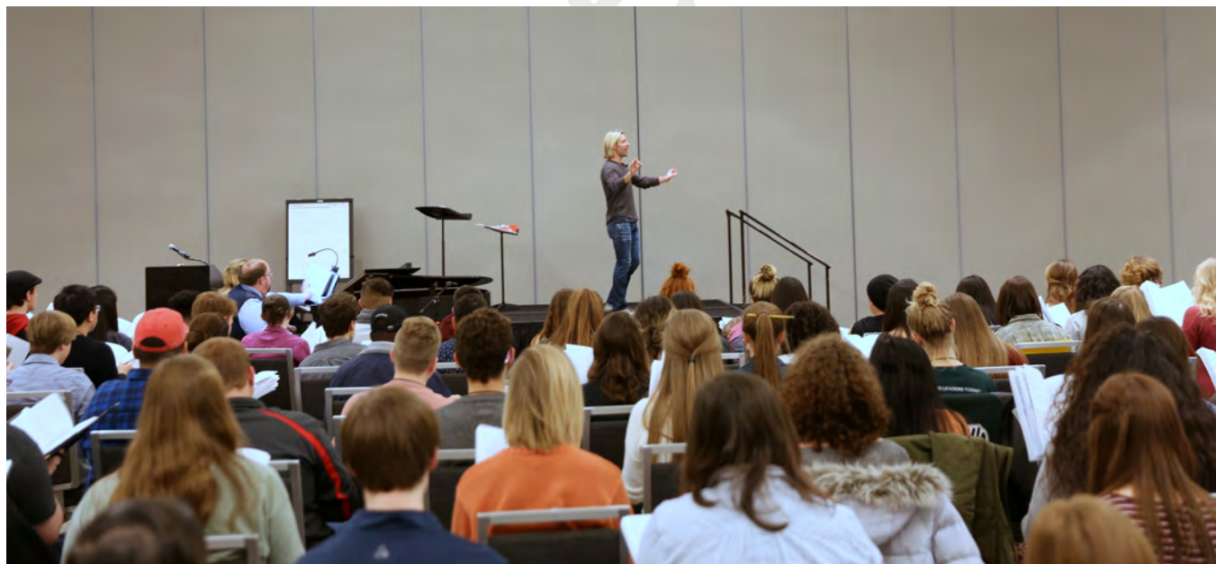
The National High School Honor Choir diretto da Eric Whitacre.

Insomma una settimana di musica bellissima e riposante. La prossima conferenza di ACDA avrà luogo a Kansas City, Missouri, in febbraio/marzo, 2019, anno in cui cadrà l'anniversario di diamante dell'American Choral Directors Association.