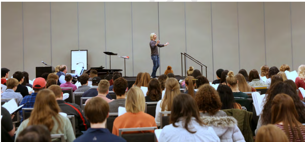
Ensayo del Coro Nacional de Honor de Escuelas Secundarias dirigido por Eric Whitacre

Una semana maravillosa con hermosa música para aquietar las almas atribuladas. La próxima Conferencia Nacional de ACDA será en Kansas City, Missouri, febrero / marzo, 2019, y serán las Bodas de Diamante de la Asociación Americana de Directores Corales.