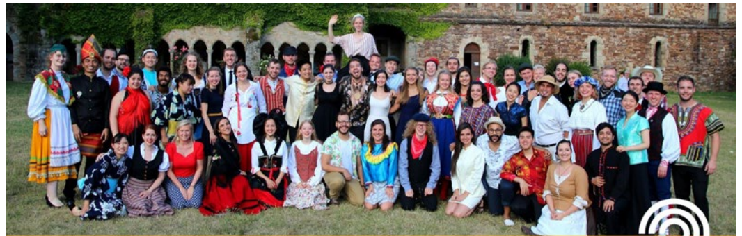
WORLD YOUTH CHOIR 2020