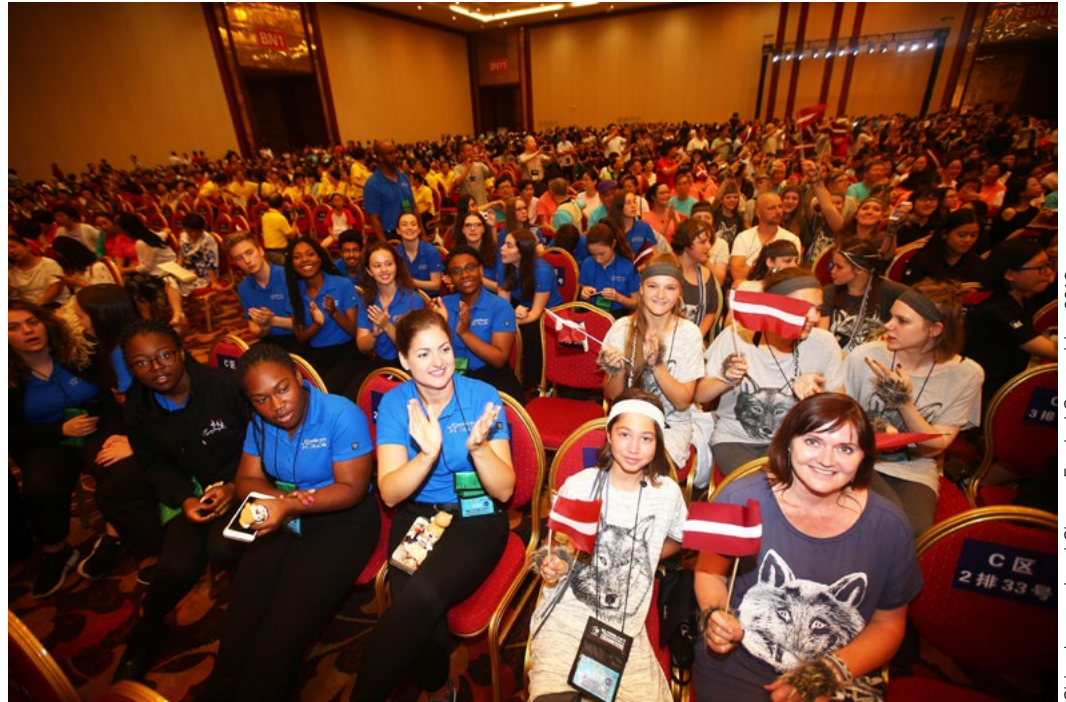
China International Chorus Festival Competition 2018