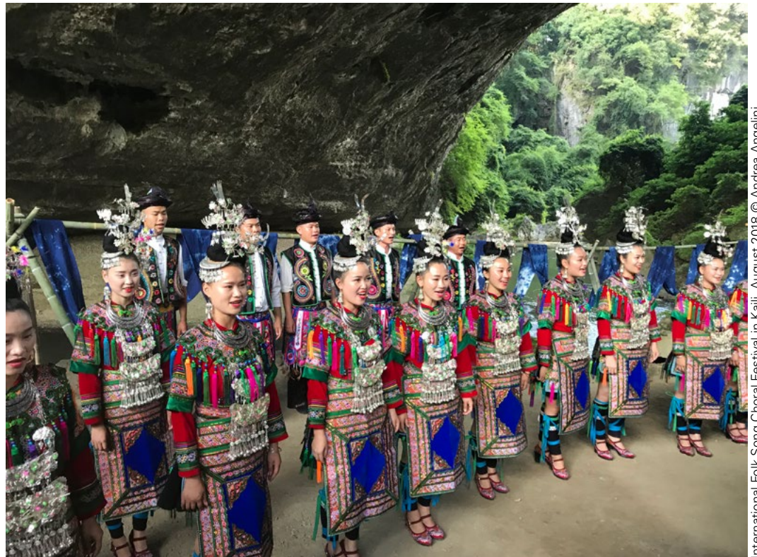
International Folk Song Choral Festival in Kaili, August 2018