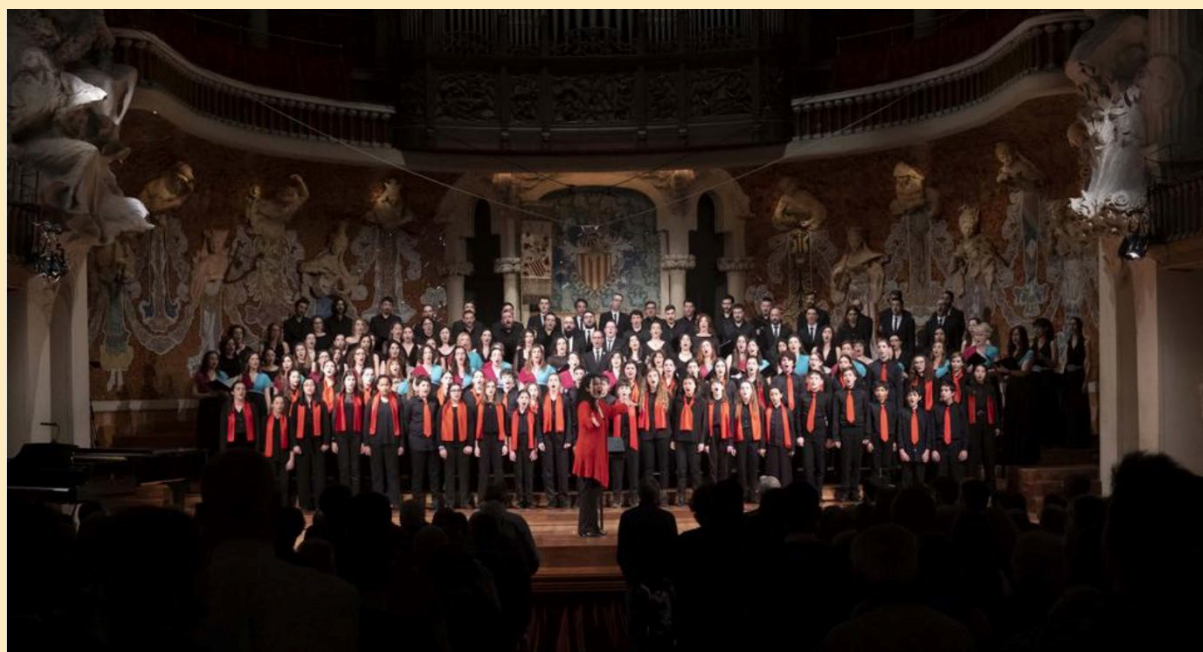
Festa de la Música Coral 2023