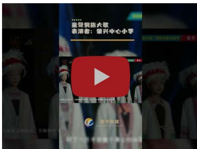
トン民謡を歌うトン族児童合唱団

IFCM より、中国黔東南国際民謡フェスティバル、および、貴州民謡文化メディアに感謝の意を表します。