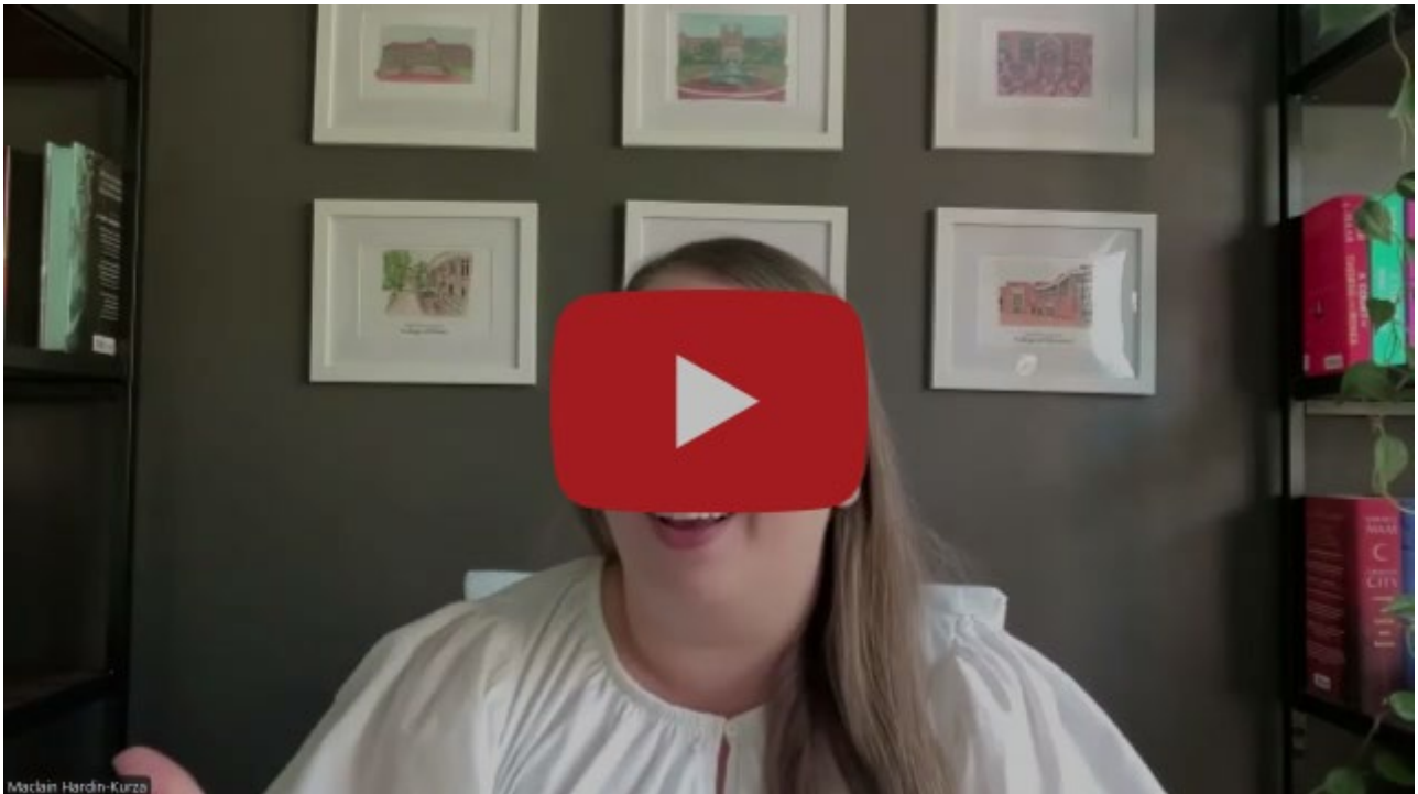
YOUNG IFCM オンライン・カフェ概要

YOUNG IFCM オンライン・カフェの全録画はこちらで視聴できます。 available to all here