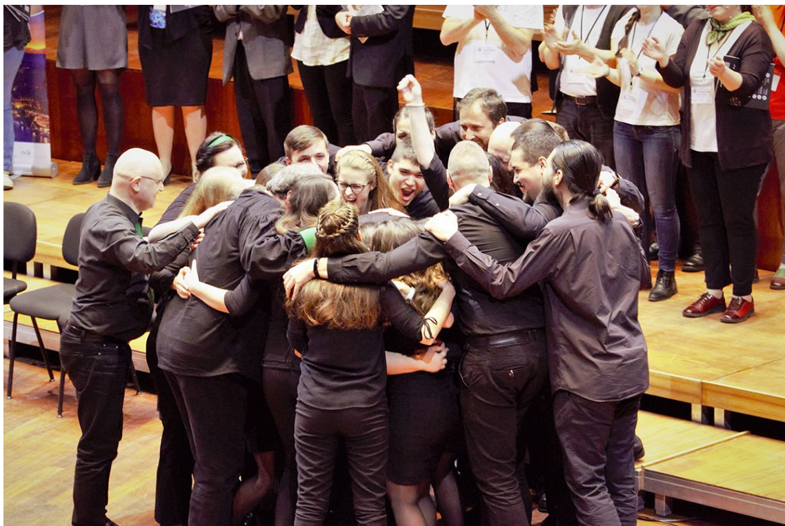
第 18 回ブダペスト国際合唱祭 & コンクールの閉幕式