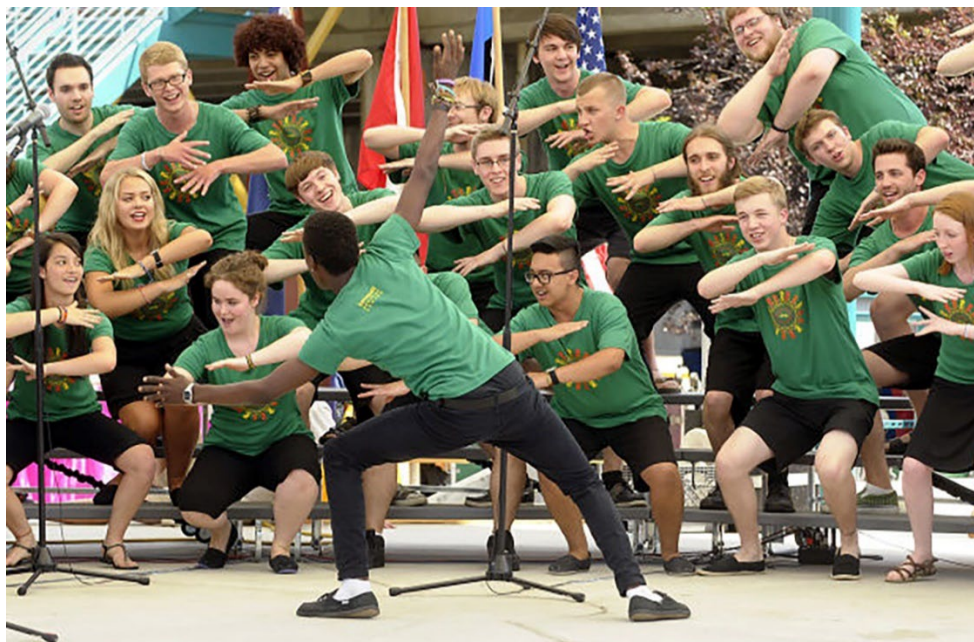
コロラ合唱団、カナダ