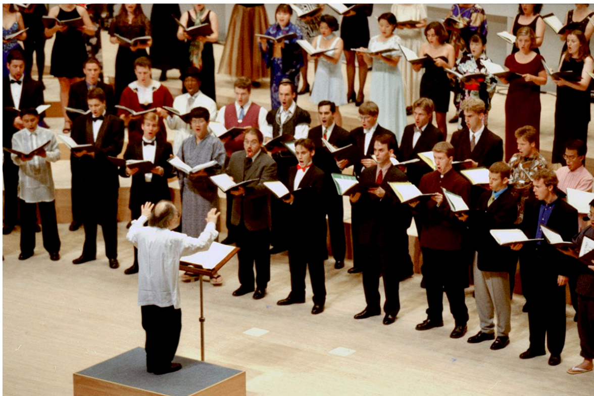
肖像、写真ともすべて