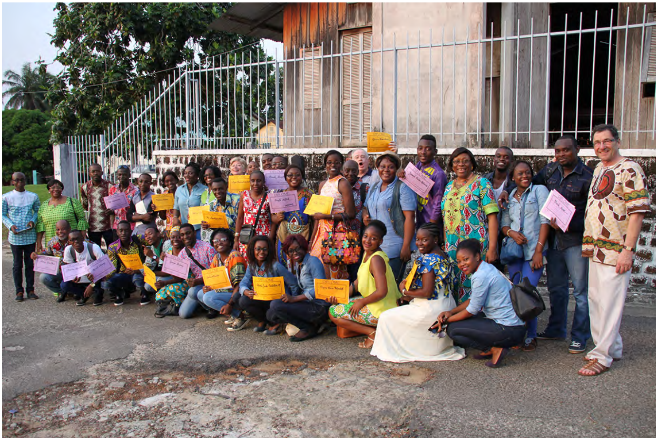
指挥无国界 2016 年 12 月在洛美, 托加