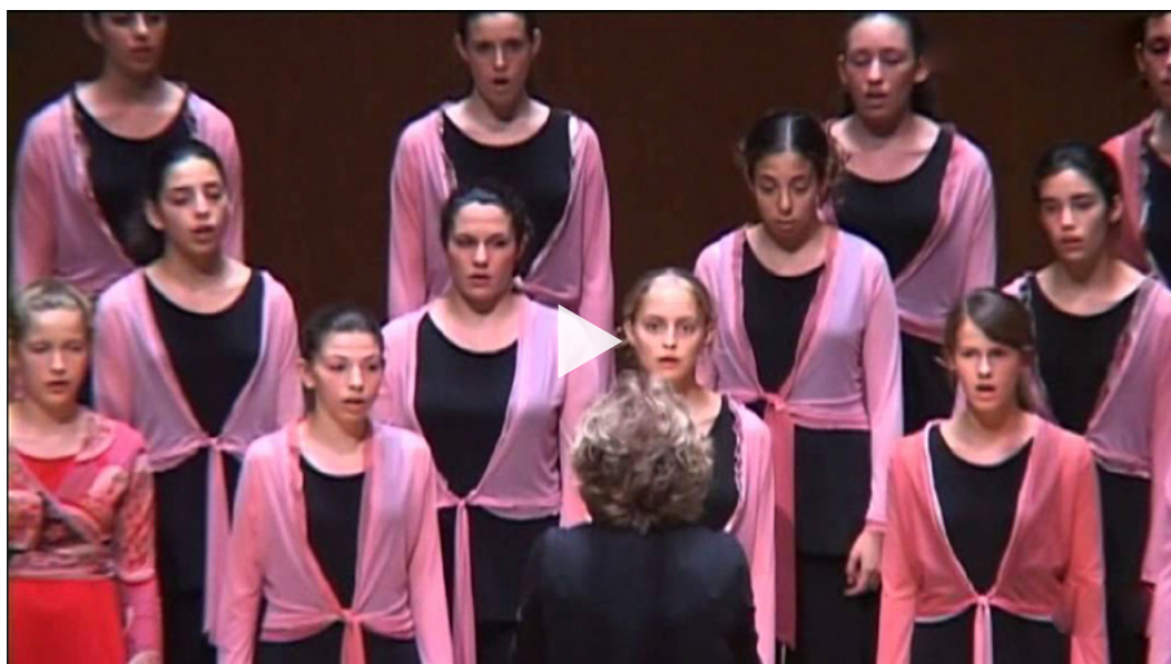
Der Efroni Choir- 2 Songs from the Yemenite tradition