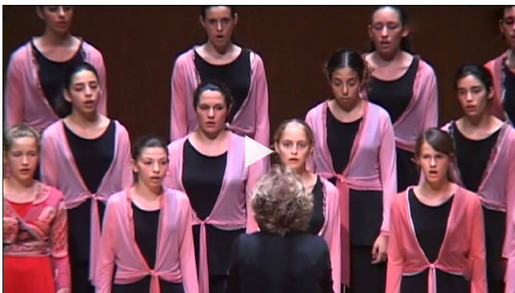
Хор Эфрони - 2 Песни из йеменской традиции