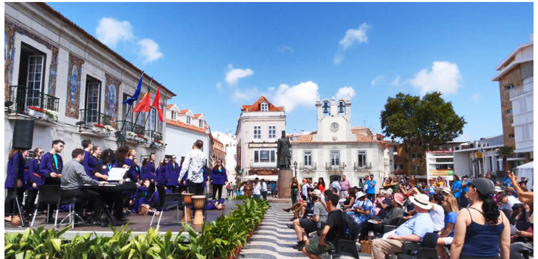
World Choral Expo 2019 in Cascais, Portugal