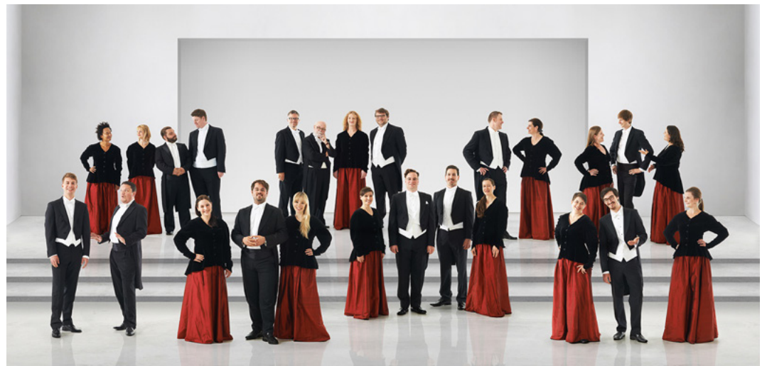
Kammerchor Stuttgart

この合唱団は、ヨーロッパの主要な合唱祭のすべてに招待されます。これまでに彼らは数々の有名なコンサートホールで演奏会を行ってきました。また、世界合唱シンポジウムに関して言えば、2020年の第12回その他、3回(ウィーン、シドニー、ソウル)招待されています。南北アメリカ、アジア、イスラエルへの定期演奏旅行は、シュトゥットガルト室内合唱団の世界的な名声を反映するものです。この団の100盤のCDのうち、45盤は、エジソン賞、ディアパソン賞、ICMA賞といった国際的な賞を受賞しています。