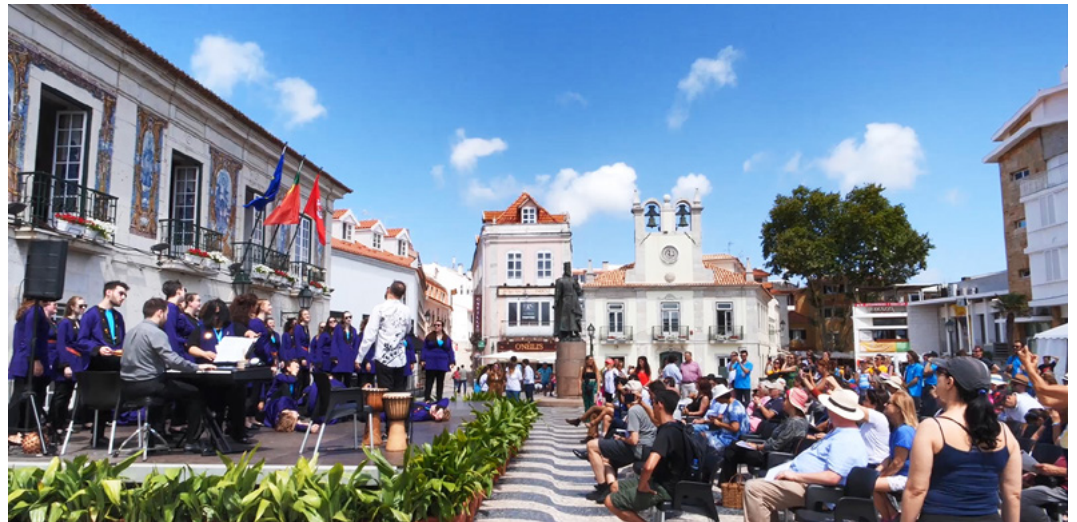
World Choral Expo 2019 in Cascais, Portugal

매달 IFCMeNEWS는 WCE 2022 초청 합창단 중 1~2개를 선보일 예정입니다. 다음은 여러분이 연주를 듣고 함께 활동하게 될 두 전문 합창단에 대한 소개입니다.