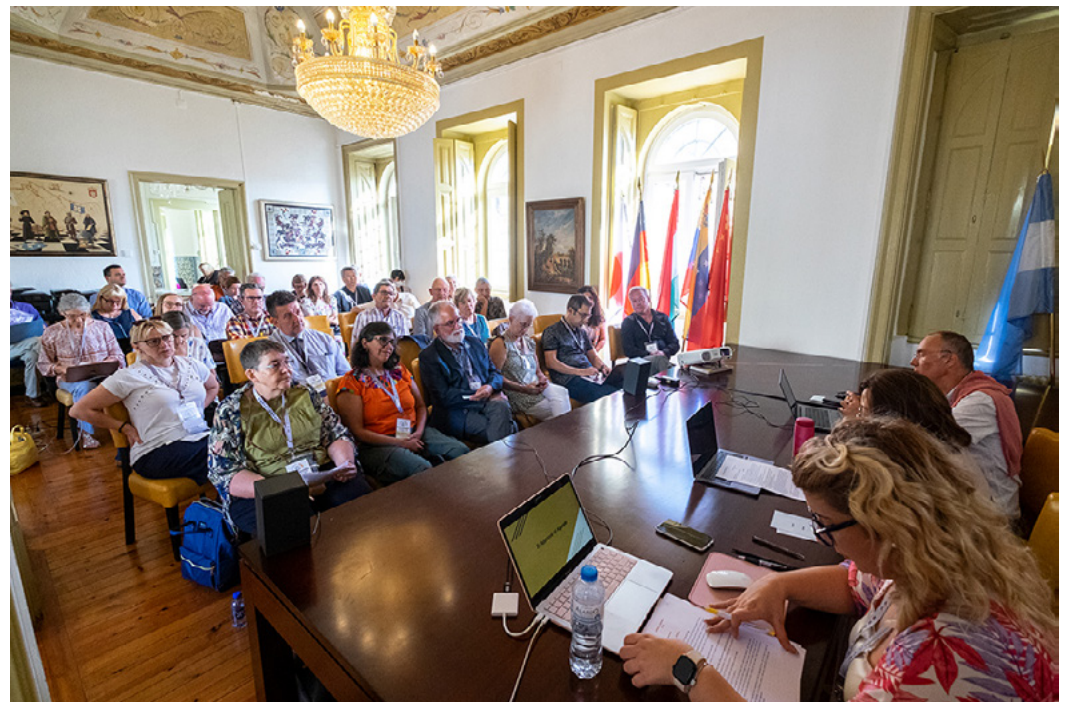
IFCM 2022 General Assembly at the Palacete dos Condes de Monte Real