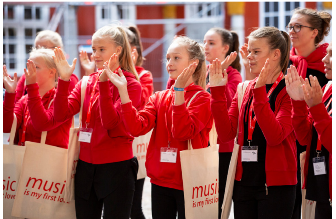
Eurotreff 2019

2021년 유로트레프 동영상 클립( EUROTREFF 2021 Trailer )을 보시고 분위기를 느껴보세요.