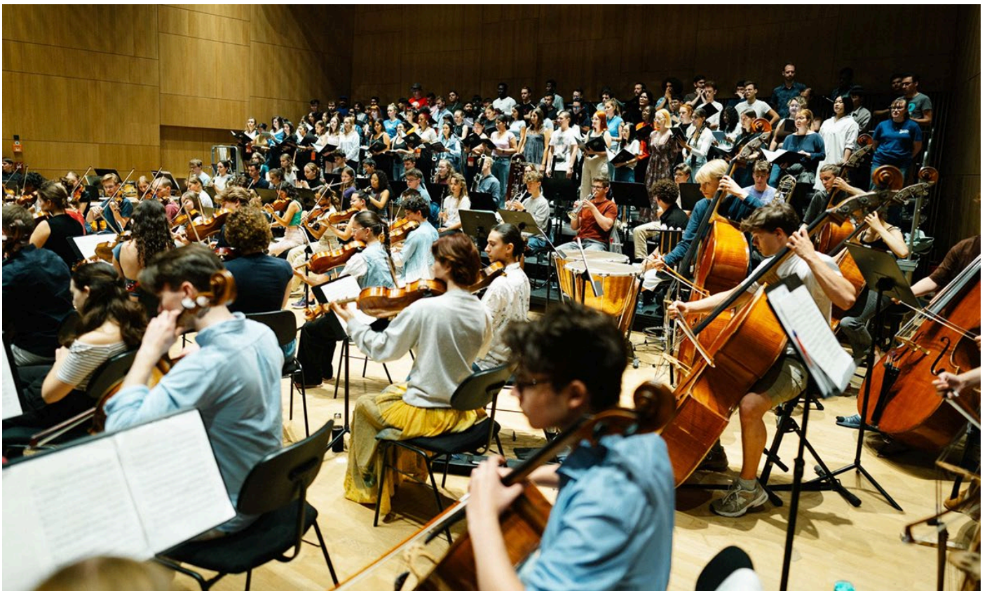
世界青少年合唱団とドイツ青少年管弦楽団

最新情報と写真はこちらでどうぞ。 WYC website 、 Facebook 、 Instagram 、 YouTube